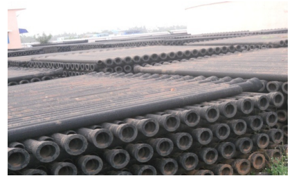
ଅକାମୀ ହୋଇପଡ଼ିରହିଥିବା ସିଆଇ(ସ୍ପନ) ପ୍ରେସର