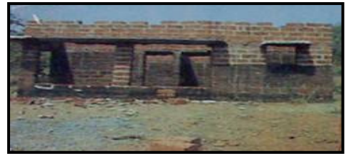
ଡଫ୍ଟର ପାହାଡ଼, ଖୋର୍ଦ୍ଧାଠାରେ ଅର୍ଦ୍ଧନିର୍ମିତ ମହାବୀର ଗୋଷ୍ଠୀ କେନ୍ଦ୍ରର ଚିତ୍ର

ଅଡିଟ୍ ଅନୁଧ୍ୟାନ କଲେ ଯେ କାର୍ଯ୍ୟର କାର୍ଯ୍ୟ କ୍ଷେତ୍ର ନିର୍ବାହନ ସମୟରେ ପରିବର୍ତ୍ତନ କରାଯାଇଥିଲା ଯେଉଁଥିରେ ପାଇଁ କାର୍ଯ୍ୟ ଅସମାପ୍ତ ରହିଥିଲା । ଏହା ସହିତ ଆଇଏ ସଂପୂର୍ଣ୍ଣ ତିସି ଏବଂ ଏମ୍ ପି କୁ ଅତିରିକ୍ତ ମଞ୍ଜୁରୀ ପାଇଁ କୌଣସି ପ୍ରସ୍ତାବ ନିବେଦନ କରାଯାଇନଥିଲେ । ସେହିଭାବରେ, ଆସ୍ତିଗୁଡ଼ିକ ଅସମାପ୍ତ ହୋଇ ରହିଛି ଏବଂ ବ୍ୟବହାରରେ ଲାଗି ନଥିବା ଯୋଗୁଁ 25.96 ଲକ୍ଷ ଟଙ୍କାର ଖର୍ଚ୍ଚ ଅପବ୍ୟୟ ହୋଇଛି ।