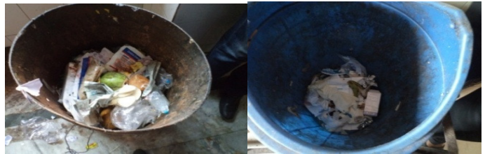
ଏସ୍‌ସିବି ଡାକ୍ତରୀ ମହାବିଦ୍ୟାଳୟ ଓ ଚିକିତ୍ସାଳୟ କଟକରେ ସମସ୍ତ ପ୍ରକାର ଜୈବ ଚିକିତ୍ସା ବର୍ଜ୍ୟବସ୍ତୁକୁ ଏକତ୍ର କରାଯାଇ ଅଳିଆ ତବାରେ ରଖାଯାଇଛି

ମହାରାଜା କୃଷ୍ଣଚନ୍ଦ୍ର ଗଜପତି) ରେ ବିଏମଡବ୍ଲ୍ୟୁ ସେଗୁଡିକର ବର୍ଗ ଅନୁଯାୟୀ ପୃଥକୀକରଣ ହୋଇନଥିଲା । ମିଶ୍ରିତ ବର୍ଜ୍ୟବସ୍ତୁକୁ ପଲିଥିନ୍ ବ୍ୟାଗରେ ରଖାଯାଇ ଜୈବ-ଚିକିତ୍ସା ବର୍ଜ୍ୟବସ୍ତୁ ଉପଚାର ପ୍ଲାଣ୍ଟର ପରିସରକୁ ସ୍ଥାନାନ୍ତର କରାଯାଇଥିଲା । ଯଦିଓ ରାଜ୍ୟ ପ୍ରଦୃଷ୍ଟ ନିୟମକ୍ରମ ବୋର୍ଡ ଦ୍ୱାରା ସଂପୃକ୍ତ ସରକାରୀ ଚିକିତ୍ସା ମହାବିଦ୍ୟାଳୟ ଏବଂ ଚିକିତ୍ସାଳୟ ଗୁଡିକୁ ଜୈବ-ଚିକିତ୍ସା ବର୍ଜ୍ୟବସ୍ତୁର ସଠିକ୍ ପୃଥକୀକରଣ ପାଇଁ ବାରମ୍ବାର ନିର୍ଦ୍ଦେଶ ଦେଇଥିଲେ ତଥାପି ତାଙ୍କ ଦ୍ୱାରା କୌଣସି କାର୍ଯ୍ୟାନୁଷ୍ଠାନ ନିଆଯାଇନଥିଲା ।