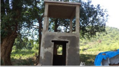
ବିଷମ ଜଟିଳ ସ୍ଥଳର ବାରିଗୁଡ଼ା, ଗଡ଼ଗଡ଼ା, ଭିତିସିର ଅସଂପୂର୍ଣ୍ଣ ବୋରଝେଲ

ଅତିବ୍ ଜିନ୍ତୁ ଲକ୍ଷ୍ୟ କରିଥିଲା ଯେ 1.17 କୋଟି ଟଙ୍କା ବ୍ୟୟ କରାଯିବା ପରେ ମଧ୍ୟ 2011-14 ମଧ୍ୟରେ ଦୁଇଟି ନମୁନା ଯାସ୍ତ ଆଇଟିଏ ରେ, ଆରମ୍ଭ କରାଯାଇଥିବା 79 ଟି ବୋରଝେଲ, ପାନୀୟ ଜଳ ଯୋଗାଣ ଏବଂ ଡଗଝେଲ ଇତ୍ୟାଦି ଅସଂପୂର୍ଣ୍ଣ ରହିଥିଲା । ବୈଦ୍ୟୁତିକ ଅସୁବିଧା, ଫଣ୍ଡ ଏବଂ କୁଶଳୀ ଶ୍ରମିକ ନ ମିଳିବାକାରଣ ହେତୁ ପ୍ରକଳ୍ପ ଅସଂପୂର୍ଣ୍ଣ ରହିଥିଲା । ଯାହାଫଳରେ 1906 ଟି ପରିବାରକୁ ପାନୀୟ ଜଳ ଯୋଗାଣ ହୋଇପାରିଲା ନାହିଁ । ନୂତନ ବିଦ୍ୟୁତ୍ ସଂଯୋଗ ପାଇଁ ନିର୍ବାହୀ ଯତ୍ନ ସାଧନକୁ ଆଇଟିଏ ନବରଙ୍ଗପୁର (ଫେବୃୟାରୀ ଏବଂ ଜୁନ 2014) ଜଣାଇବା ସତ୍ତ୍ୱେ, ଅକ୍ଟୋବର 2014 ପର୍ଯ୍ୟନ୍ତ ଏହାର ସଂଯୋଗକରଣ ହୋଇନଥିଲା ।