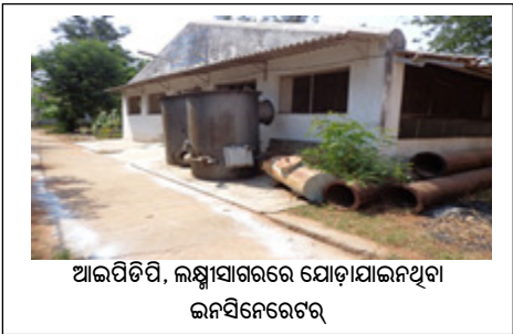
ଆଇପିଡିପି, ଲକ୍ଷ୍ମୀସାଗରରେ ଯୋଡାଯାଇଥିବା ଇନସିନେରେଟର

ଡିସେମ୍ବର 2008 ରେ ଗ୍ରହଣ କରାଯାଇଥିବା ଇନସିନେରେଟର ବିକ୍ରି ହୋଇପଡିଥିଲା (ମେ 2014) ।