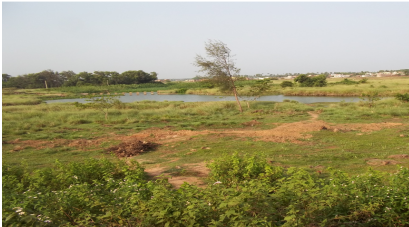
ଖାଲି ପଡ଼ିଥିବା ଜଳ ବିଶୋଧନ ପାଇଁ ଉଦ୍ଦିଷ୍ଟ ସ୍ଥାନ