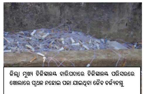
ଜିଲ୍ଲା ମୁଖ୍ୟ ଚିକିତ୍ସାଳୟ ବାରିପଦାରେ ଚିକିତ୍ସାଳୟ ପରିସରରେ ଖୋଲାରେ ପୃଥକ ନହୋଇ ପକା ଯାଇଥିବା ଜୈବ ବର୍ଜ୍ୟବସ୍ତୁ