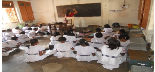
କେଜିବିଭି, ଫୁଲବାଣୀରେ ଛାତ୍ରୀମାନେ ଶ୍ରେଣୀଗୃହରେ ପାଠ ପଢ଼ିବା ସହିତ ଶୋରଥିଲେ