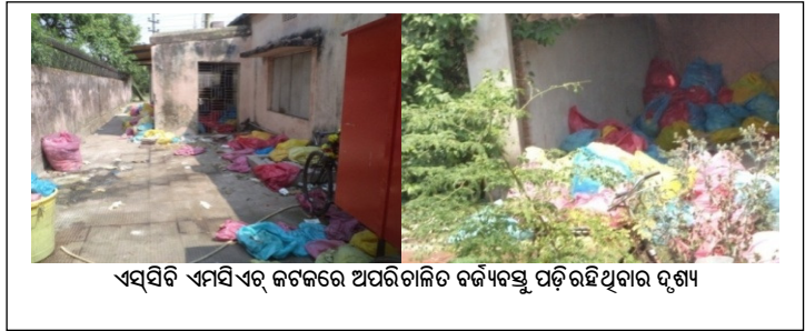
ଏସ୍‌ସିଟି ଏମସିଏବ୍ କଟକରେ ଅପରିଚାଳିତ ବର୍ଜ୍ୟବସ୍ତୁ ପଡ଼ି ରହିଥିବାର ଦୃଶ୍ୟ

ପ୍ରଚୁର ପରିମାଣର ଜୈବ-ଚିକିତ୍ସା, ବୈଜ୍ୟବସ୍ତୁ ବାହ୍ୟ ସଂସ୍ଥାଦ୍ୱାରା ପରିଚାଳିତ ହେଉଥିବା ଉପଚାର ପ୍ଲାଟ୍ ନିକଟବର୍ତ୍ତୀ ଛପର ଘରେ ଗଚ୍ଛିତ ହୋଇଥିବାର ଦେଖାଯାଇଥିଲା । ଯୁଗ୍ମ ନିରୀକ୍ଷଣ ସମୟରେ ରାଜ୍ୟ ପ୍ରଦୁଷଣ ନିୟନ୍ତ୍ରଣ ବୋର୍ଡ଼ ଓ ବାହ୍ୟ ସଂସ୍ଥା 10 ର ପ୍ରତିନିଧିମାନେ ସାକାର କଲେ ଯେ ଜୈବ-ଚିକିତ୍ସା ବୈଜ୍ୟବସ୍ତୁଗୁଡ଼ିକ 10 ଦିନରୁ ଅଧିକ ପୂରୁଣା ଓ ଅସାମ୍ବ୍ୟକର । ତେଣୁ ଧାର୍ଯ୍ୟ 48 ଘଣ୍ଟାରୁ ଅଧିକ ସମୟ ଏହାକୁ ସଂରକ୍ଷିତ କରି ରଖିବା ସାମ୍ବ୍ୟ ସଂକଟ ଓ ବାୟୁ ପ୍ରଦୁଷଣ ହେବାର ଭୟକୁ ବଢ଼ାଇଥାଏ ।