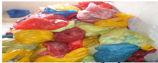
ଏଜେନ୍ସୀଙ୍କ ଦ୍ଵାରା ଲେବଲ ନ ଥିବା ଜୈବ ବର୍ଜ୍ୟବସ୍ତୁ ତବାର ପରିବହନ

ମହାରାଜା କୃଷ୍ଣଚନ୍ଦ୍ର ଗଜପତି ତାତ୍ତ୍ଵରା ମହାବିଦ୍ୟାଳୟ ଓ ଚିକିତ୍ସାଳୟ ଦର୍ଶାଇଥିଲେ (ଜୁନ୍ 2014) ଯେ, ଯେହେତୁ ପାତ୍ରଗୁଡ଼ିକ ପୁରୁଣା ହୋଇଯାଇଥିଲା, ସେଗୁଡ଼ିକର ନାମପଠି ନଷ୍ଟ ହୋଇଯାଇଛି ଏବଂ ଭବିଷ୍ୟତରେ ସଠିକ୍ ନାମପଠିକରଣ କରାଯିବା ପାଇଁ ପ୍ରତିଶ୍ରୁତି ଦେଲେ । ଅନ୍ୟ ଦୁଇଟି ତାତ୍ତ୍ଵରା ମହାବିଦ୍ୟାଳୟ ଓ ଚିକିତ୍ସାଳୟକୁ କୌଣସି ଉତ୍ତର ମିଳିନଥିଲା ।