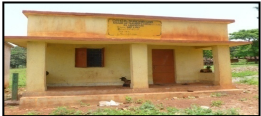
କୋଇଡା ବ୍ଲକର କୁଲିଶା ଗ୍ରାମର କମନ୍ଦା ଗୋଷ୍ଠୀ କେନ୍ଦ୍ରର ଚିତ୍ର ଯାହା ହତ୍ୟାକରଣ ନହୋଇ ପଡ଼ିରହିଛି

ସାଂସଦ ସଦସ୍ୟ କ୍ଷେତ୍ରୀୟ ଉନ୍ନୟନ ପରିକଳ୍ପନା ନିୟମାବଳୀ ଅନୁଯାୟୀ କାର୍ଯ୍ୟ ମଞ୍ଜୁର କରିବା ପୂର୍ବରୁ ତିନି ସଂପୂର୍ଣ୍ଣ ବ୍ୟବହାରକାରୀ ସଂସ୍ଥାଠାରୁ ପ୍ରସ୍ତାବିତ ଆସିର କମ୍ ସମ୍ପାଦନ, ରକ୍ଷଣାବେକ୍ଷଣ ଏବଂ ଭରଣପୋଷଣ ବିଷୟରେ ଦୃଢ଼ ପ୍ରତିଶ୍ରୁତି ନେବା ଆବଶ୍ୟକ । କାର୍ଯ୍ୟ ସମାପ୍ତି ପରେ, ଆଇ.ଏ. ମାନେ ସଂପୂର୍ଣ୍ଣ ତିନିଙ୍କୁ କାର୍ଯ୍ୟ ସମାପ୍ତି ରିପୋର୍ଟ ଉପଲବ୍ଧି କରାଇବା ଆବଶ୍ୟକ ଏବଂ ଆସିକୁ ବ୍ୟବହାରକାରୀ ସଂସ୍ଥାକୁ ବିନା ବିଳମ୍ବରେ ସ୍ଥାନାନ୍ତରଣ ପାଇଁ ବ୍ୟବସ୍ଥା କରିବା ଆବଶ୍ୟକ ।