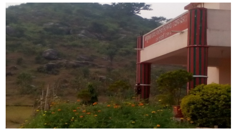
ସଂପୂର୍ଣ୍ଣ ପାଚେରୀ ନଥିବା ଚ.ନୂଆଗାଁ କେଜିବିଭି ହଷ୍ଟେଲ